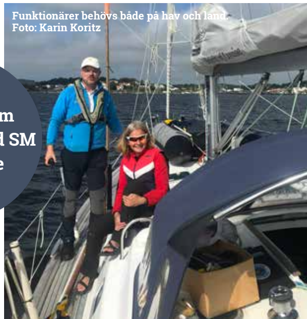
Funktionärer behövs både på hav och land.

Var med som funktionär vid SM i Trissjolle