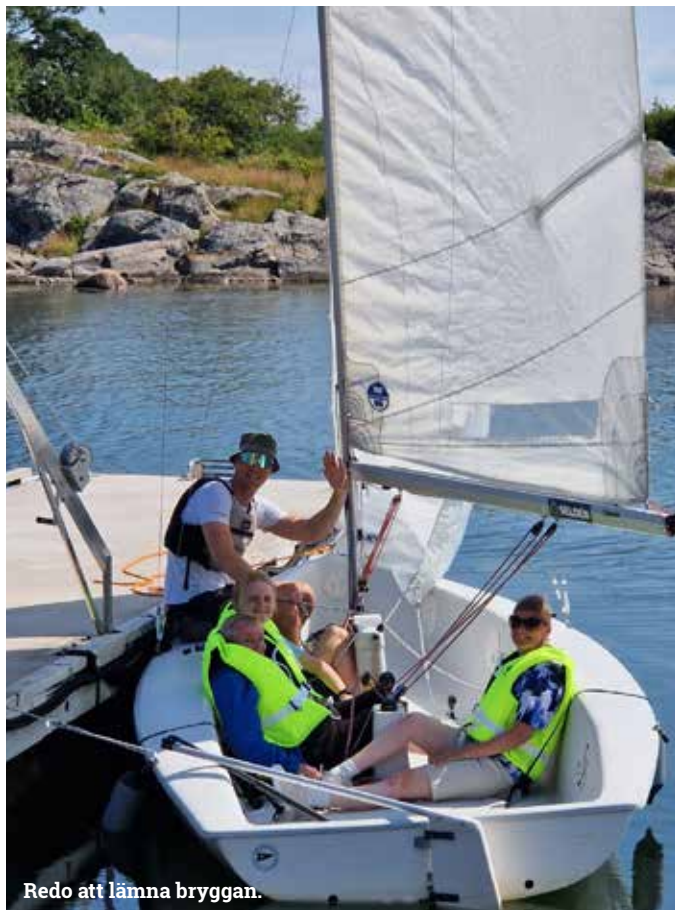
Redo att lämna bryggan.

Neuroförbundet Göteborg har en semesteranläggning i Onsala som heter D & J Strannegården. Där kan våra medlemmar hyra in sig med helpension, och diverse aktiviteter erbjuds varje dag under hela deras vistelse.