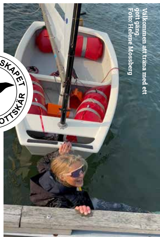
Välkommen att träna med ett gott gäng.