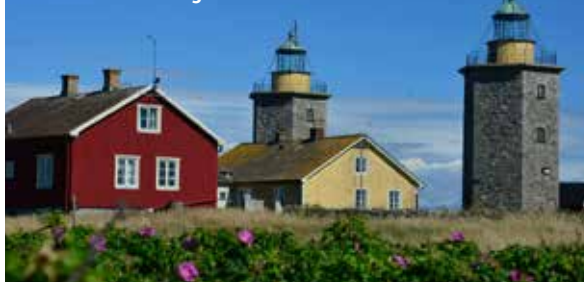
Nidingen – Kattegatts smycke.

Swish: 123 036 30 44 Bankgiro: 771-7374 Ange namn, adress och e-post!