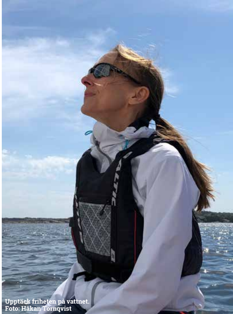
Upptäck friheten på vattnet.

Att gå seglarskola som vuxen är ett utmärkt sätt att förvandla dröm till verklighet. Oavsett om du vill segla för nöjes skull eller siktar på att bli en erfaren skeppare, ger en kurs dig den kunskap och de färdigheter du behöver för att tryggt kunna ta dig fram på vattnet.